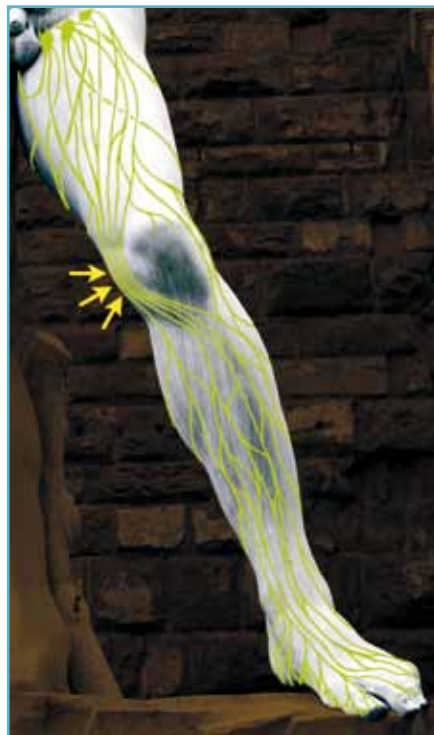
Abb. 1: Das „ventromediale Bündel“ wird auch „Flaschenhals des Lymphabflusses“ genannt.

Einige Tausend Ärzte in Deutschland bieten Fettabsaugungen an. Derzeit werden pro Jahr rund 250.000 dieser Eingriffe – meist aus kosmetischen Gründen – durchgeführt. Doch zur Behandlung des Lipödems sind die üblicherweise eingesetzten Methoden der Fettabsaugung nicht geeignet! Hier ist die Gefahr, Lymphgefäße zu verletzen und damit ein Lipo-Lymphödem zu erzeugen, extrem hoch. Denn bei der Fettabsaugung als „Schönheitsoperation“ führt der Arzt die Absaugkanüle kreuz und quer durch die abzusaugende Zone, um ein möglichst gleichmäßiges Ergebnis zu erzielen. Diese Criss-Cross-Technik eignet sich jedoch nicht zur Absaugung des Lipödems an den Beinen und Armen. Hier muss die Kanüle unbedingt parallel zu den Lymphgefäßen („achsengerecht“) geführt werden. Andernfalls wäre die Gefahr zu groß, Lymphbahnen zu verletzen. Diese tolerieren zwar eine Zugbelastung in Längsrichtung, eine Krafteinwirkung (Scherkräfte) von der Seite her dagegen nicht.